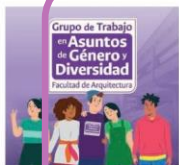
Grupo de Trabajo en Asuntos de Género y Diversidad

La Facultad de Arquitectura confirmó el Grupo de Trabajo en Asuntos de Género y Diversidad, con el fin de identificar y proponer las acciones que como comunidad académica podemos implementar para abordar los asuntos de género y diversidad desde las particularidades de nuestra Facultad.