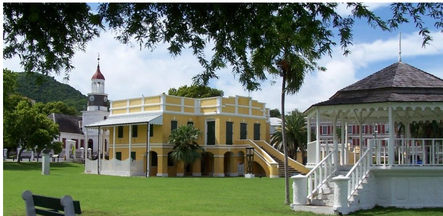
Christiansted, Saint Croix, Islas Vírgenes, EEUU. Fotografía de Juan David Chávez G., 2012.