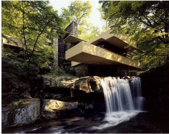
Frank Lloyd Wright, residencia Kaufmann, 1939, Fayette, Pensilvania, Estados Unidos.